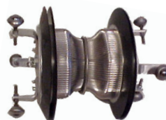
8. Dragvagn. Stabiliserar verktyget och förhindrar kantring vid dragning i böjar.