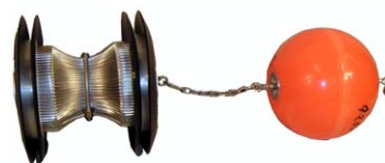
7. Dragkula. Lämplig vid dragning genom rörböjar